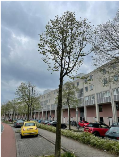
Streefwaarde voor snoeien is Kroon : stam = 2 : 1. Hier precies andersom.

Volle aandacht van ons krijgt het gemeentelijk snoeibeleid bij het opkronen van de bomen. Dat gaat vaak mis. Zowel voor bomen langs wegen als bomen in een park. Takken worden te hoog afgezaagd waarbij bomen tot lollies en potloden gereduceerd worden. En snoeien aan bomen in een park is, behalve als de veiligheid in het geding is, uit den boze volgens ons.