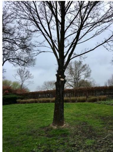
Snoeien van bomen in parken. Behalve voor veiligheid nergens voor nodig.

Wil je meer weten over groengroep Zusterpark Voordorp kijk dan eens op Zusterpark Voordorp - Nationaal Park Utrechtse Heuvelrug (np-utrechtseheuvelrug.nl) en www.zusterparken.nl .